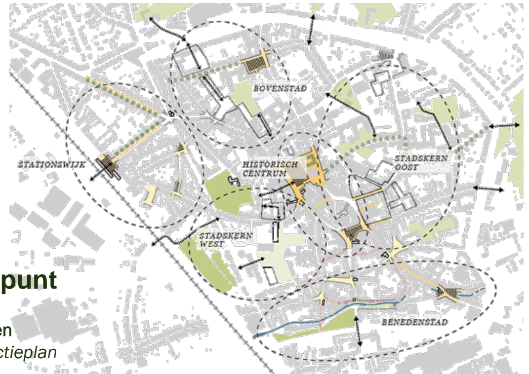
Kaart: Stads kernversterking Tienen Stuurgroep Fase 2: Presentatie actieplan 25.08.2016, p.7