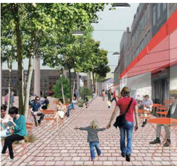
Toegankelijke en veilige wandelstraat langs de horecazaken.