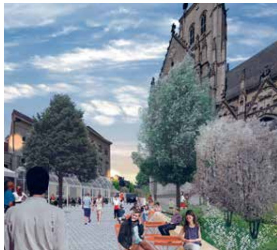
Aangenaam vertoeven op de Kalkmarkt.