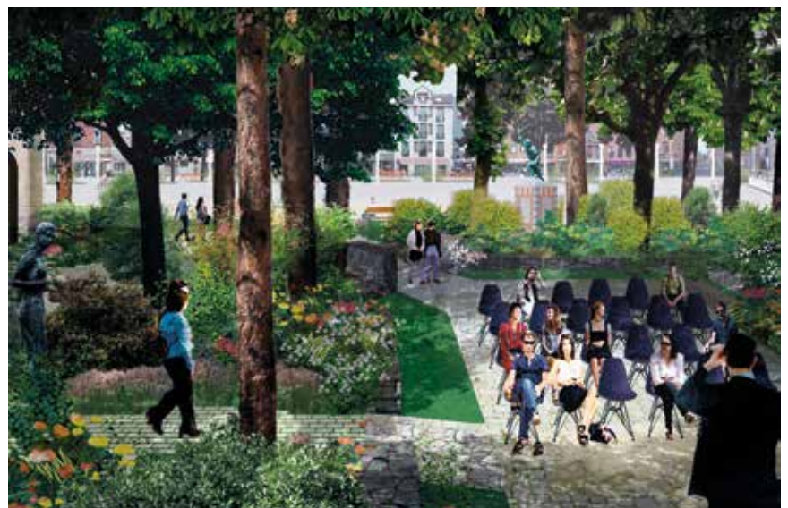
De kerktuin op het Heldensquare.

Diagonaal over de Grote Markt komt er een doorsteek van de Leuvensestraat naar de Nieuwstraat in Portugese graniet. Voor de terrassen en de aangrenzende voetgangerszone wordt gebruikgemaakt van gezaagde kasseien, hakschoenvriendelijk en toegankelijk voor minder mobiele mensen.