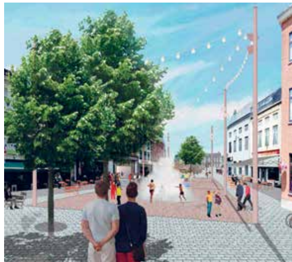
De Schapenmarkt met waterpartij.