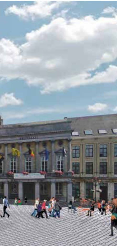
Doorsteek tussen Leuvensestraat en Nieuwstraat.