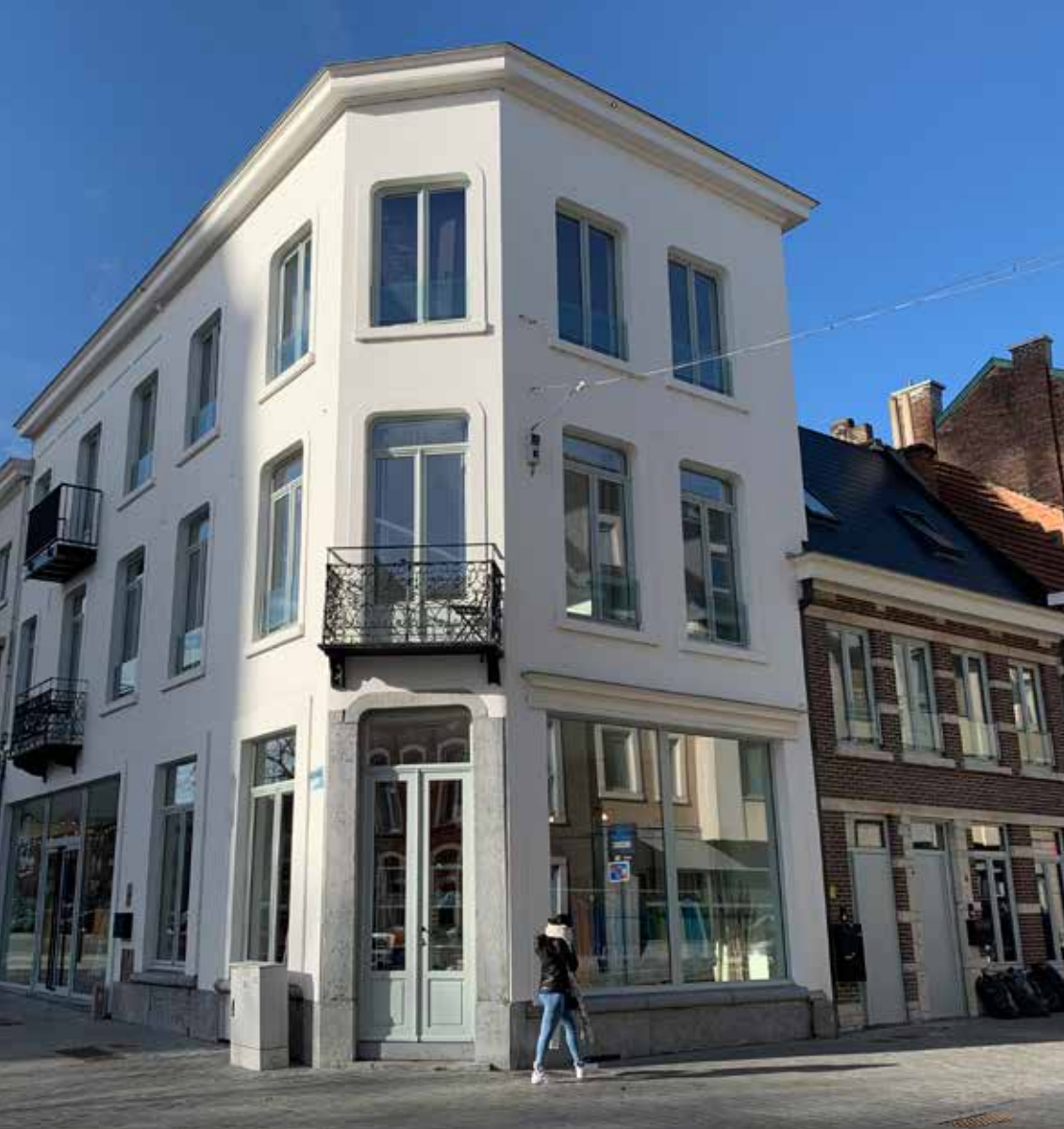
Onbewoonbaar verklaard pand op de hoek van de Grote Markt met de Gilainstraat dat volledig gerenoveerd werd.