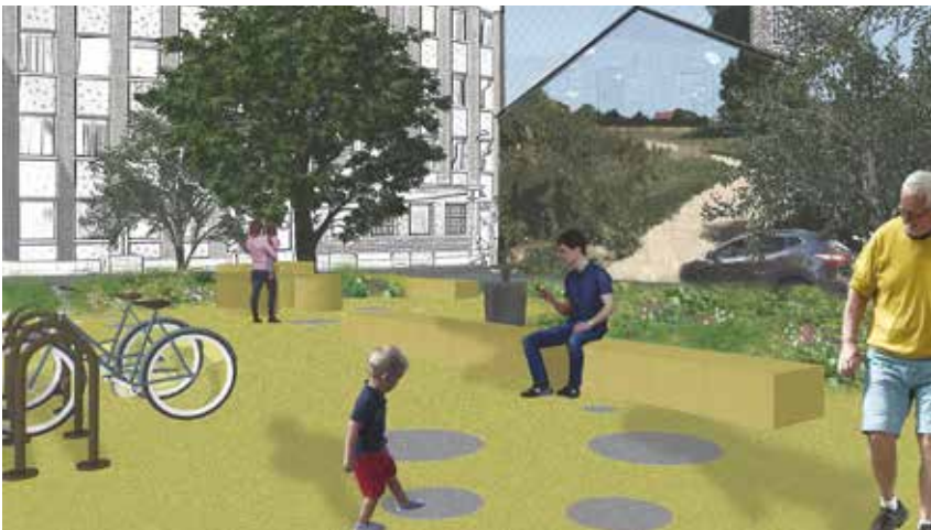
Sfeerbeeld plein langs de Broekstraat.

De Waaibergstraat en het Sint-Jorisplein wachten op een volledige heraanleg, maar krijgen in afwachting een tijdelijke inrichting. We ontharden waar kan en zorgen dat er meer ruimte is voor groen. Daarnaast worden er bloembakken en zit- en speelelementen geplaatst en zal er hier en daar een kleurrijke print verschijnen op het asfalt. De eerste ingrepen zal je dit voorjaar al kunnen zien.