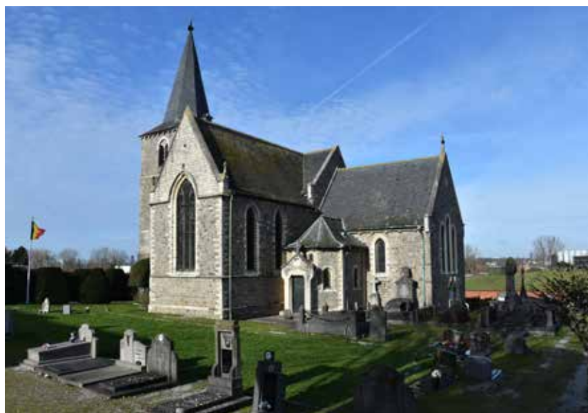
De begraafplaats in Grimde kreeg een groene, onderhoudsvriendelijke metamorfose.

Momenteel zijn alle begraafplaatsen vergroend, op het kerkhof in Haken-dover na. Dat wordt na de renovatie van de kerk aangepakt.