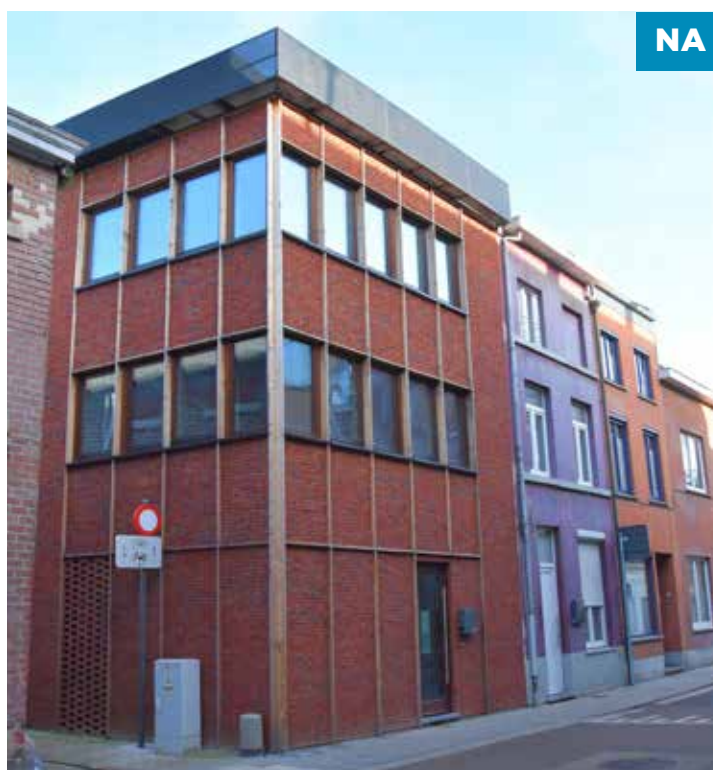
Duurzaam gerenoveerd pand in de Hoegaardenstraat.

Zowel de controle op leegstand als op verwaarlozing gebeurt ‘uitpandig’ of met andere woorden vanop het openbaar domein. In 2022 voerden we zo 149 controles uit.