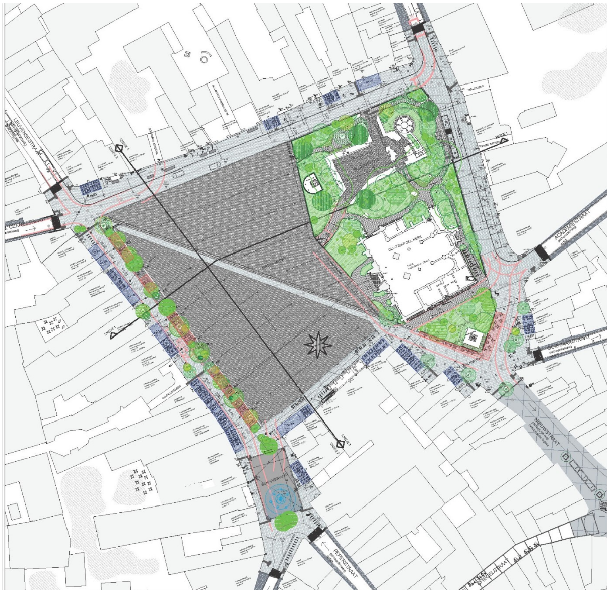
Plan met afbakening van terraszones – Winterterrassen (blauw) en zomerterrassen (rood)

Het ontwerp van de Grote Markt, Kalkmarkt en Schapenmarkt voorziet in de realisatie van een zomerterrassen die vrij staan in de ruimte en winterterrassen tegen de gevels van bestaande en nieuwe horecazaken. Het is de wens van het stadsbestuur dat er op deze zomerterrassen en de winterterrassen een uniforme beeldkwaliteit ontstaat. Mede daardoor kan de horeca op de Grote Markt een kwalitatieve schaalspiong maken en zal er op het vernieuwde marktplein een nieuwe dynamiek ontstaan.