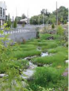
Referentie foto oeververandering