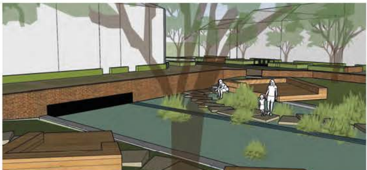
12a to 12d: Het beeld openlegging Grote Gete