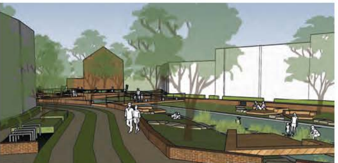
12a to 12d: Het beeld openlegging Grote Gete