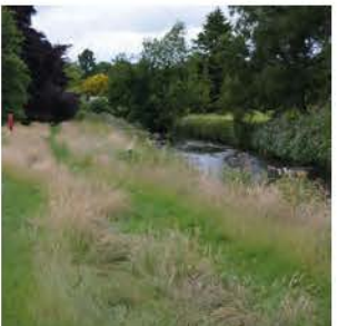
Referentie foto oeververandering