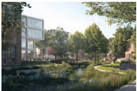
Referentie beeld openlegging vlotter