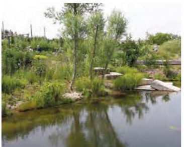
Referentie foto oeververandering