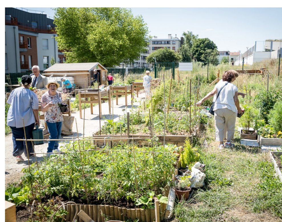
... als bruisende ontmoetingsplek voor de buurt.