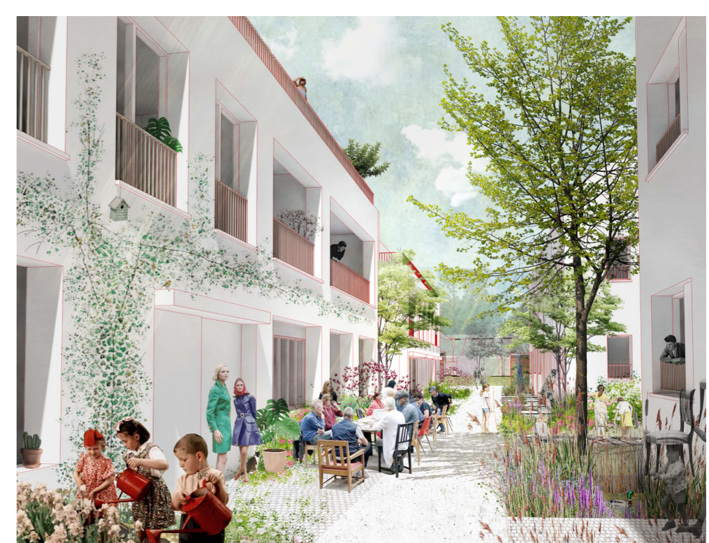
De tuinstraten als aangenaam woonkader.