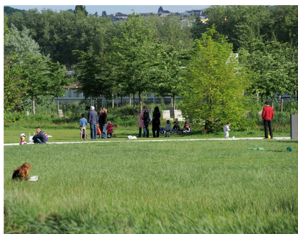
Een flexibele en open parkruimte...