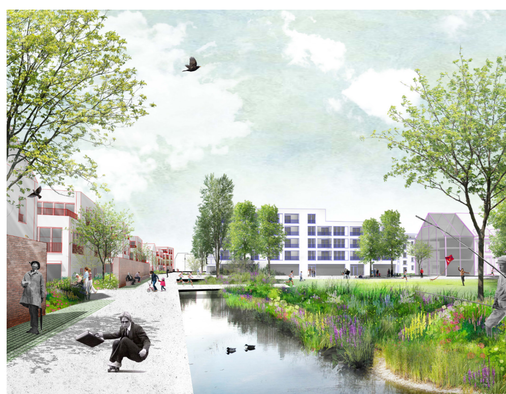
De noord-zuid promenade als ruggengraat...