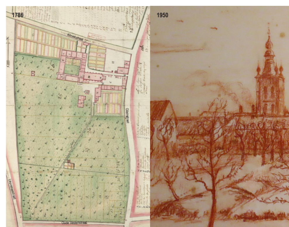
... met een geschiedenis...