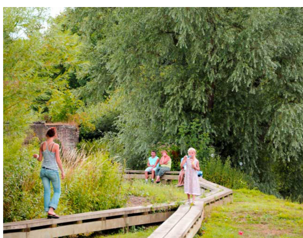
... met integratie van speelfuncties en aandacht voor biodiversiteit en natuur.