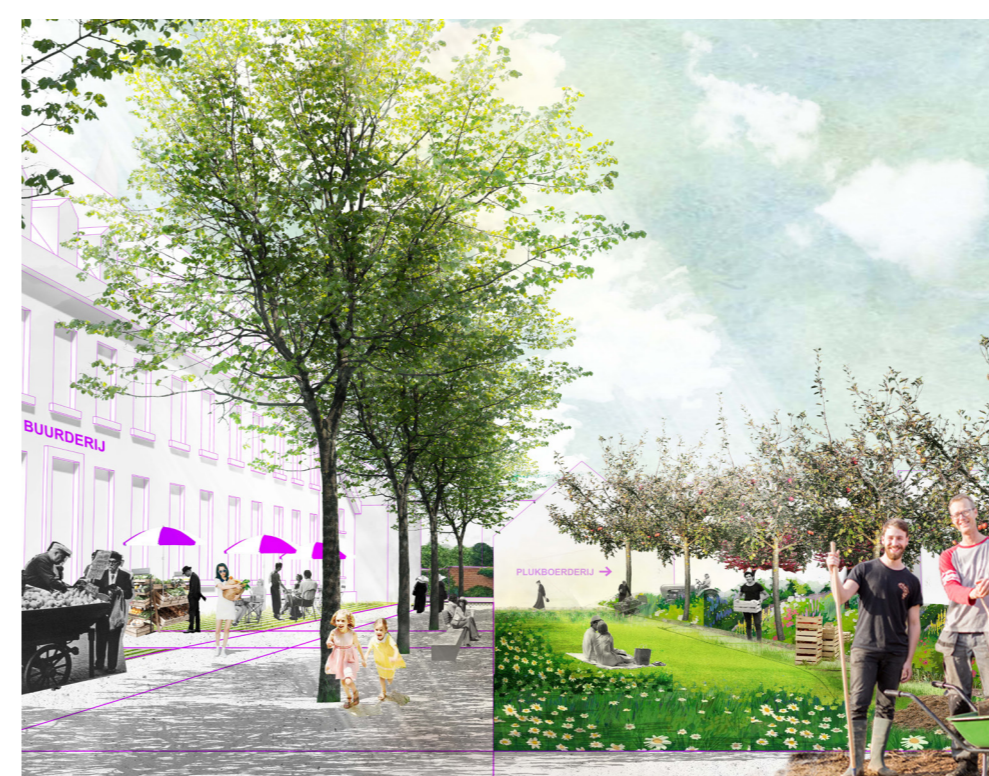
Een productief landschap...