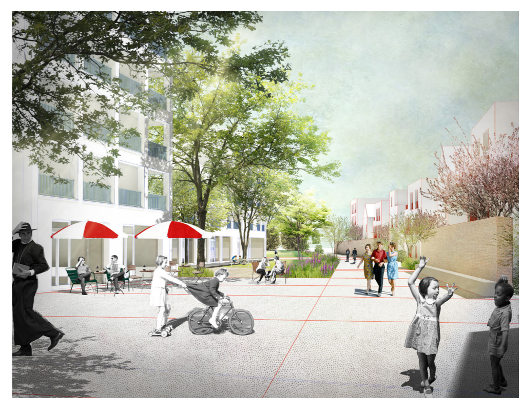
De voorpleintjes als link met de omliggende straten.