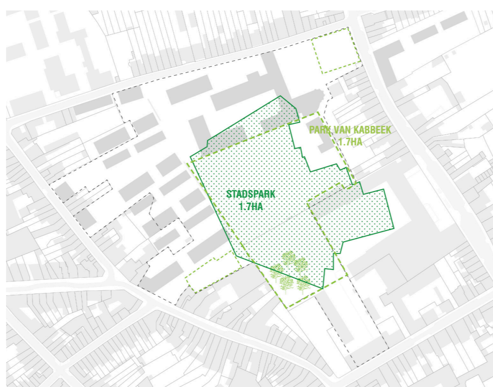
... op maat van Tienen...