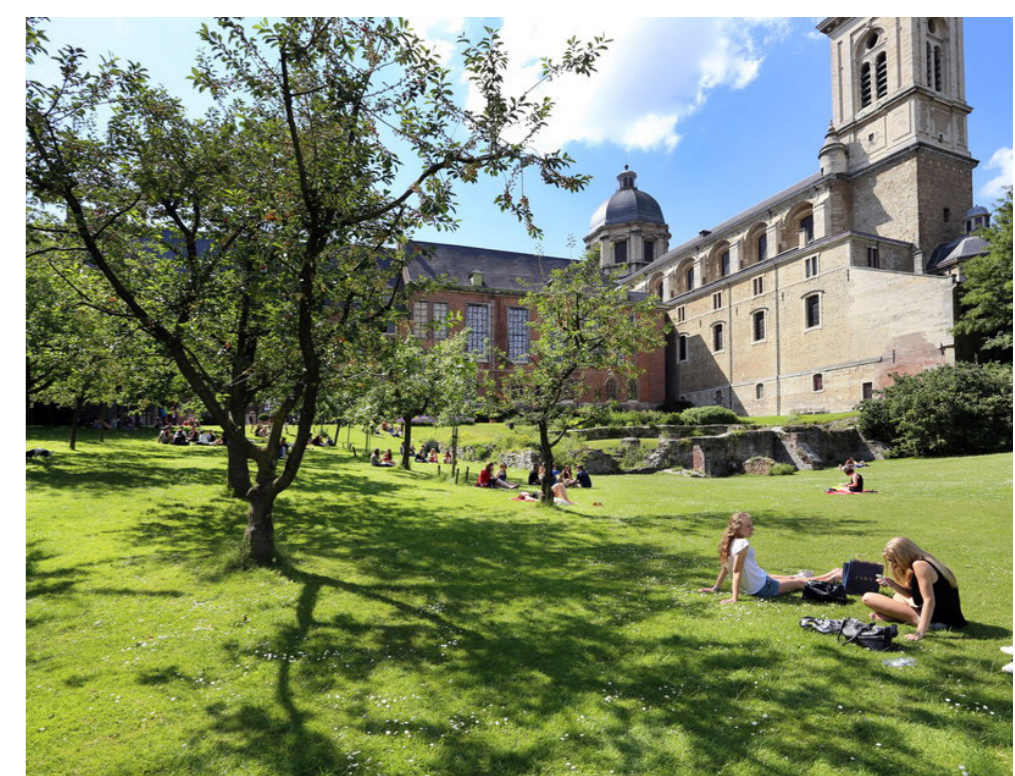
De stadsboomgaard als groene oase.