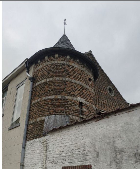
Torentje in de Torsinweg