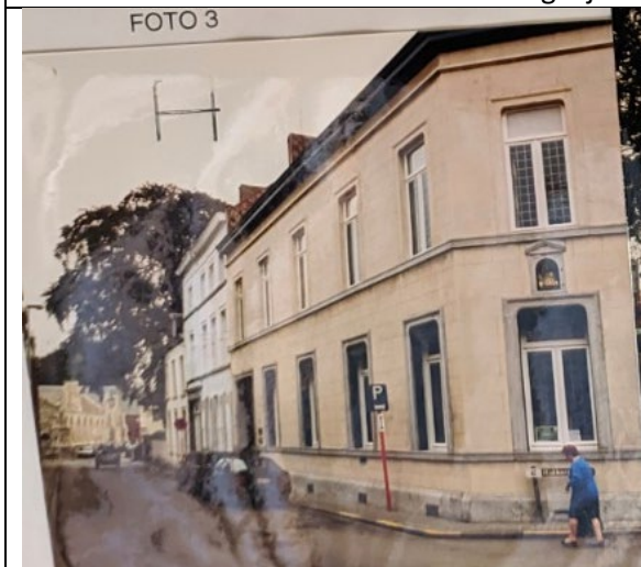
Toestand in 1998