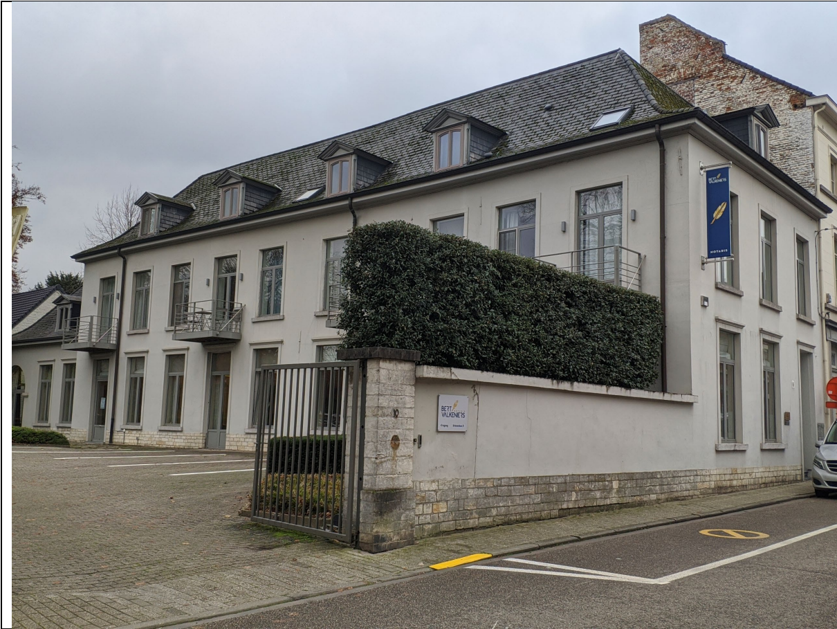
Foto zijgevel uit 2022