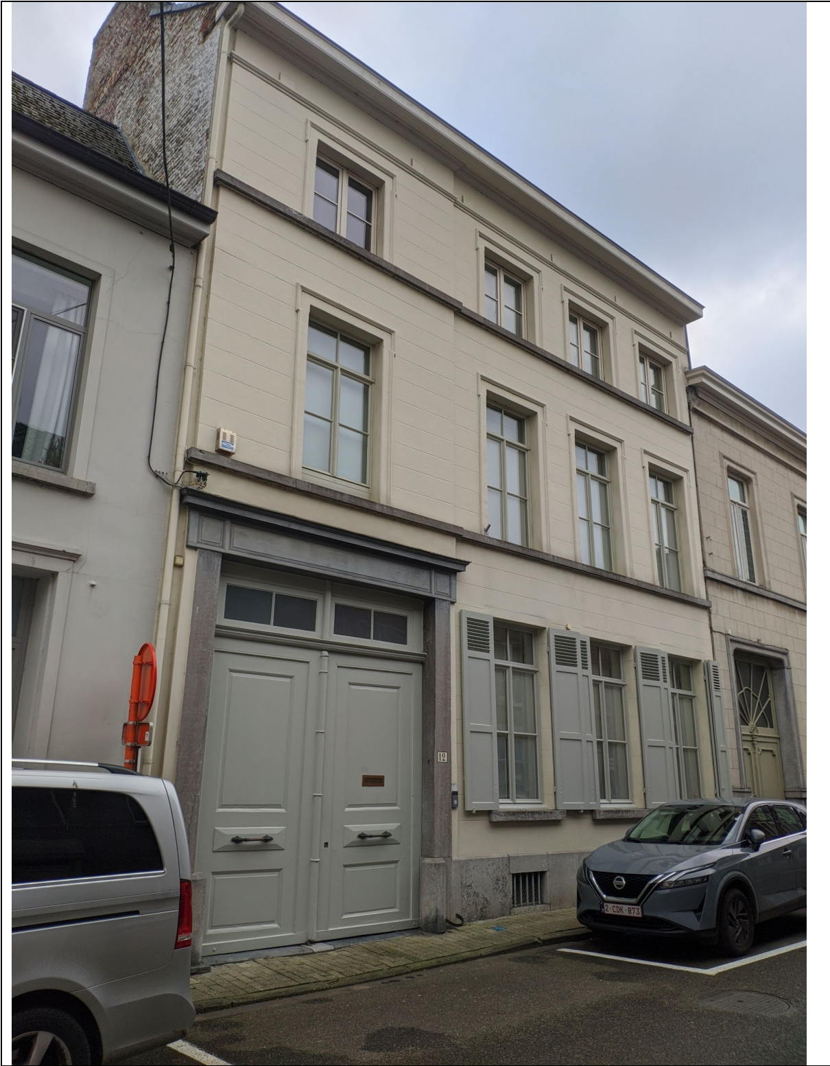
Voorgevel in 2022