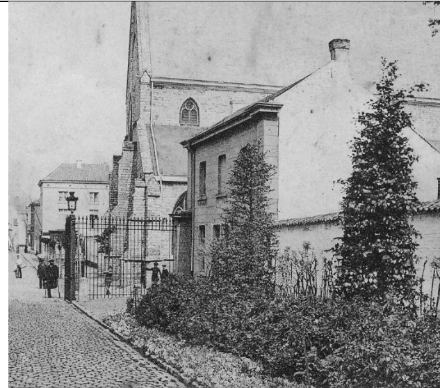
Foto omstreeks 1900: merk op dat de hekken vóór de woning gelegen waren