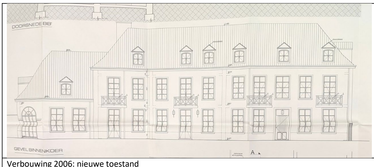
Verbouwing 2006: nieuwe toestand