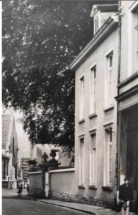
Poortpijlers en kant Potterijstraat omstreeks 1900: twee zware poortpijlers zichtbaar links naast de woning