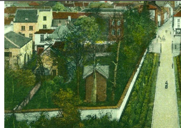
Zicht op de tuin met prieltje omstreeks 1900?

verdieping. De historische traphal met trap werd verwijderd. De zeven historische spanten bleven vermoedelijk wel behouden.