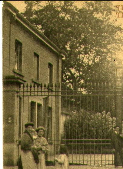
Foto omstreeks 1900: merk op dat de hekken vóór de woning gelegen waren