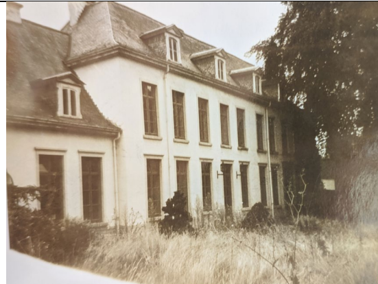
Het gebouw vóór de verbouwing van 1983