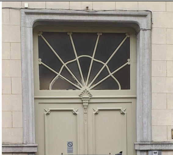
Fraai versierde inkompoort met bovenlicht met zonnemotief