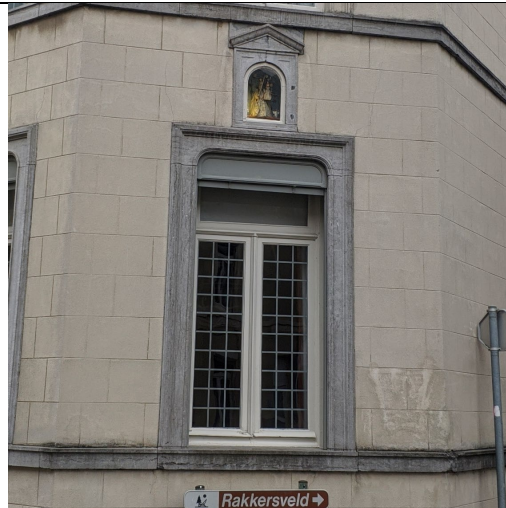
Hoektravee met gevelniskapelletje