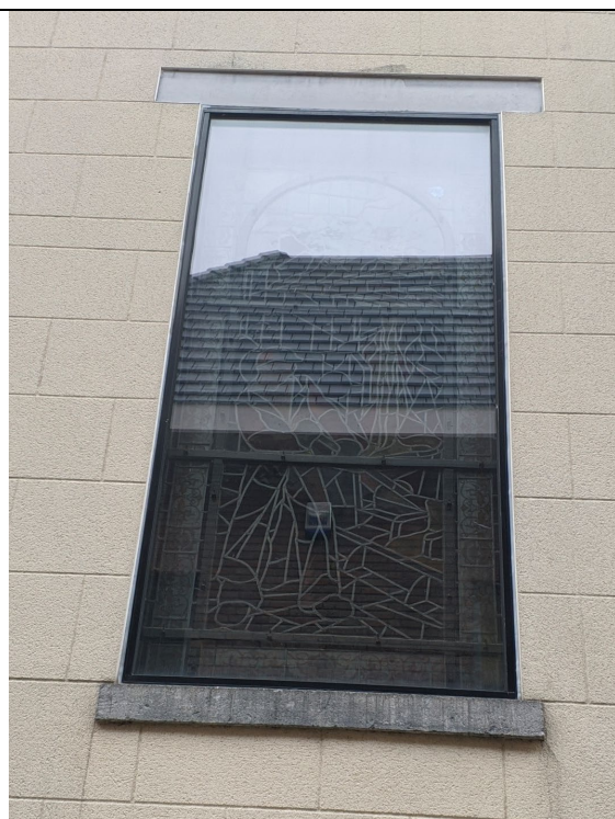
Glas-in-loodraam in de traphal kant Torsinweg