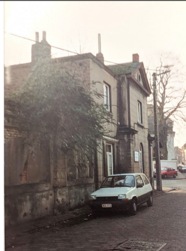
Foto's vóór de nieuwbouw van 1991