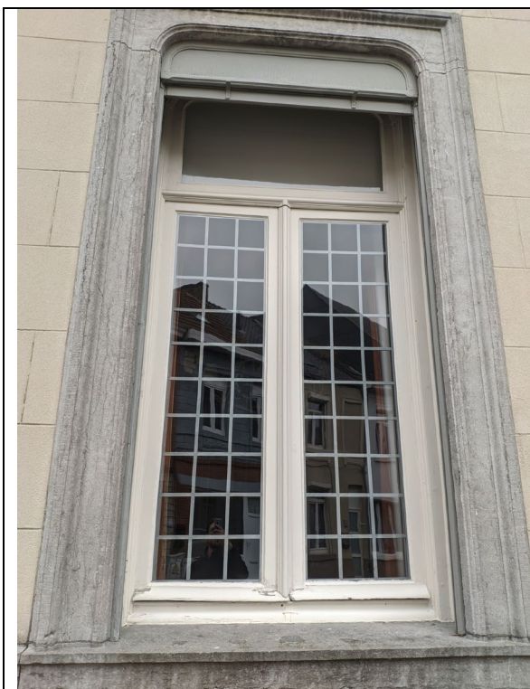
Origineel houten schrijnwerk en rolluiken