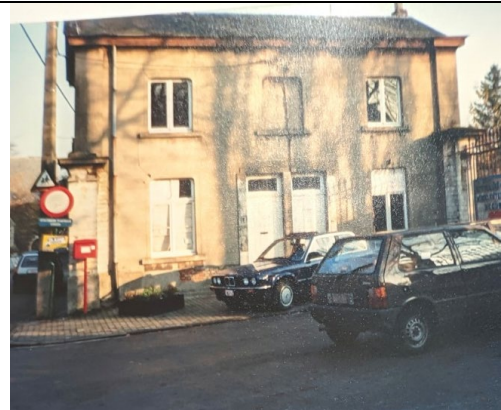
Foto's vóór de nieuwbouw van 1991