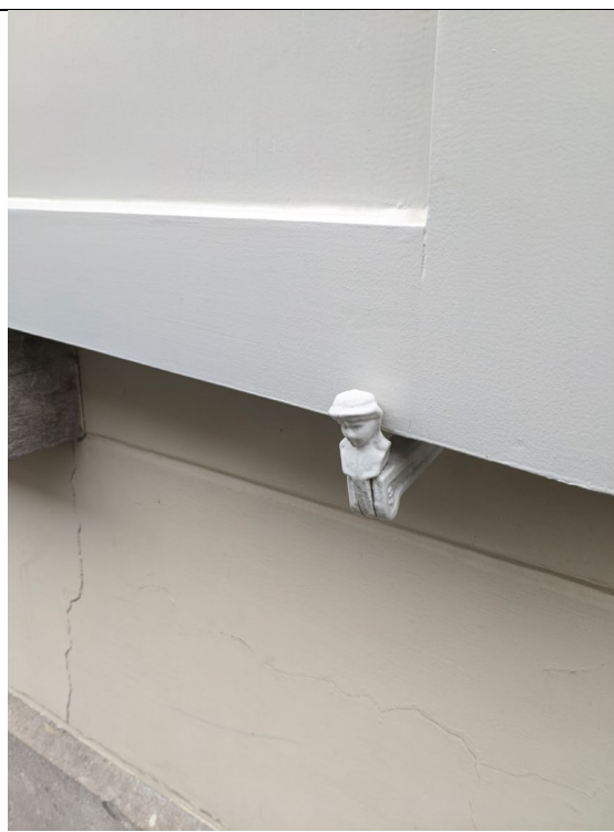
Luik vastzetter in de vorm van een hoofd