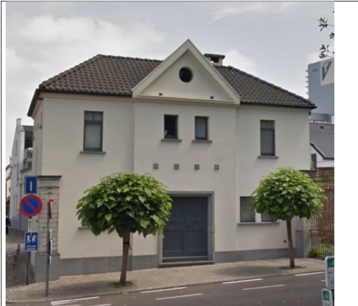
Woning in 2020