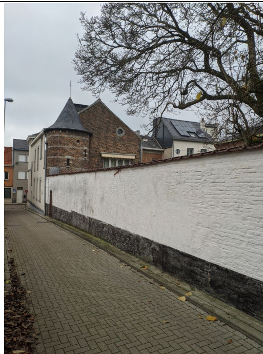
Historische muur rond de tuinen van het begijnhof met speklagen in kwartsiet